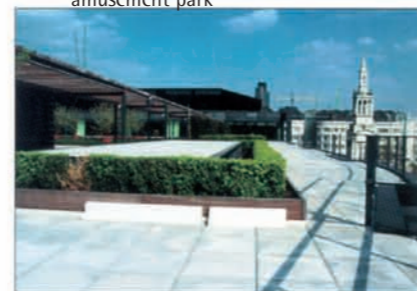
U.K. - Office Building - London