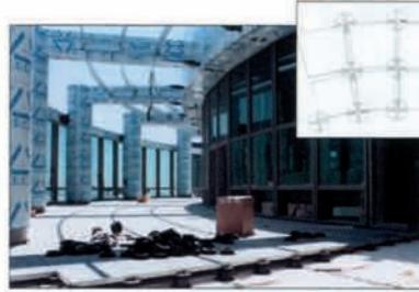
TURKEY - Istanbul