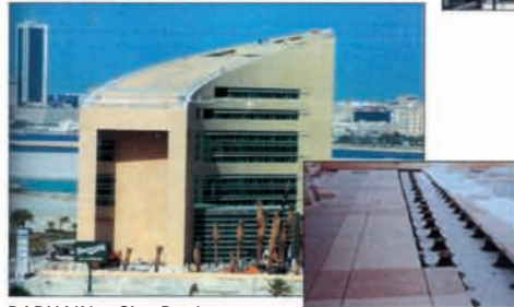
BARHAIN - City Bank