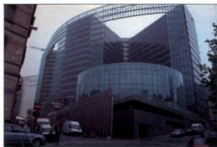
BELGIUM - European Commission