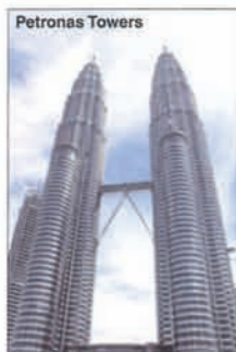
MALAYSIA Kuala Lumpur