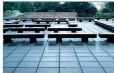
USA - Memorial Hospital - Chicago