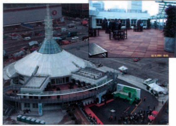
HONG KONG - Integer Sky garden