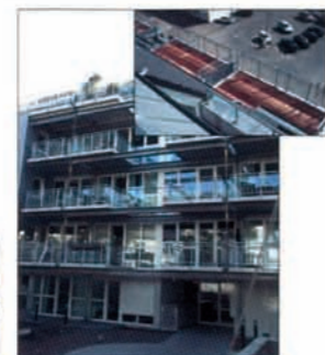
GERMANY - Mansion Condomnium