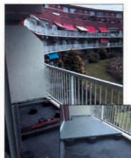
HOLLAND - Balconies