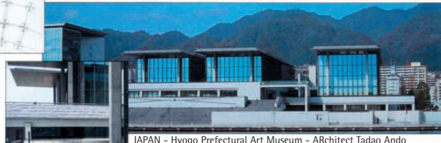
JAPAN - Hyogo Prefectural Art Museum - ARchitect Tadao Ando