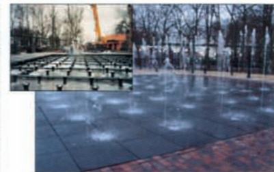
BELGIUM - interactive water fontaine amusement park