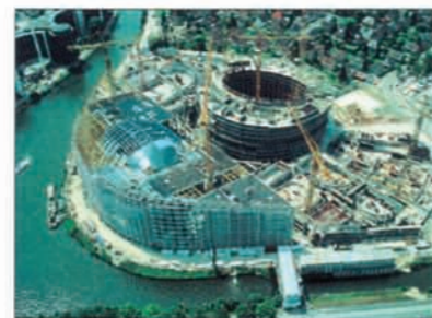
FRANCE - European Parliament - Strasbourg