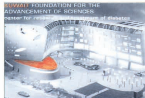
KUWAIT - Center for research and treatment of Diabetes